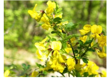
Grmoliki grašar razgranjeni je listopadni grm koji naraste do 1 m.