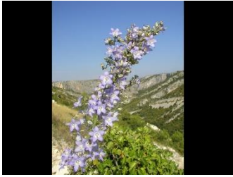
Piramidalni zvončić je jadransko-ilirski endem.