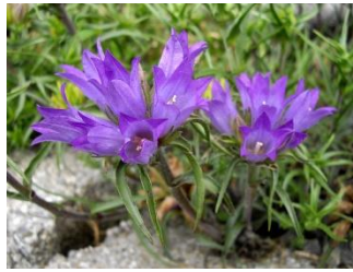
Uskolisno zvonce endemična je biljka primorskog dijela Dinarskih planina.